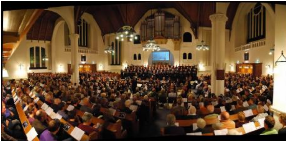
Interieur Grote Kerk